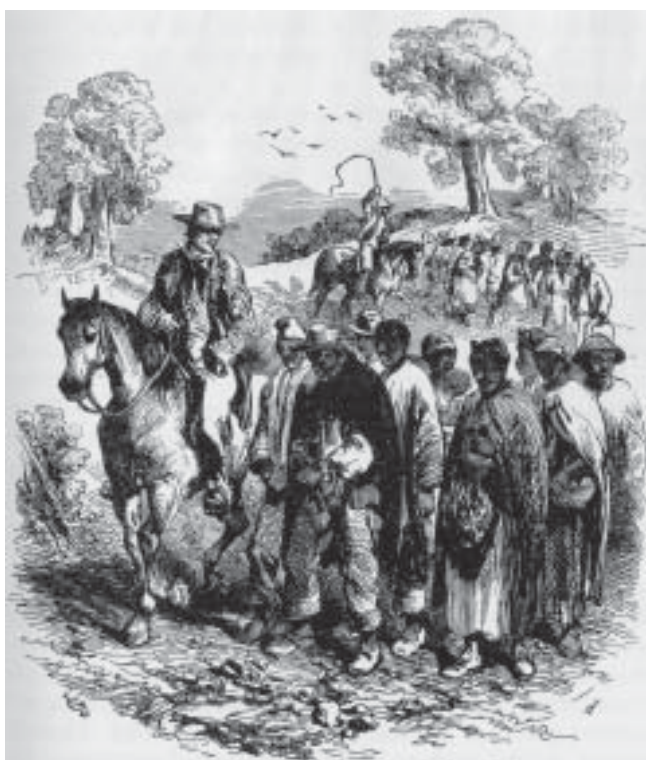
Slaveeier på vei fra sørstatene med en slaveflokk og alt det andre han eier, for å kolonisere det tidligere Mexico

Det er ikke noe menneskes selvsagte plikt å vie seg helt og holdent til å rykke denne verdens onder opp