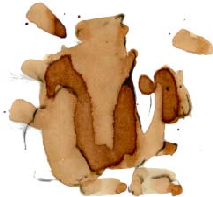
Hvilende kamel bærer en ku

Uten hensyn til mine synspunkter, mine meninger, mine ønsker, min vilje og mine erklæringer drives jeg gjennom livet, som en trebit sluppet ned i en vill og brusende flod. Jeg slynges rundt, dukkes under og virvler av sted, oppslukt av veldige vannmasser, inntil jeg, liksom tilfeldig, kastes opp på bredden, slik at jeg kan kjenne lys og varme og milde,