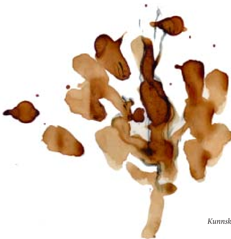
Kunnskapens tre/fallende mann

Jeg sitter ganske enkelt her og er altså av den oppfatning at mitt liv må være slik. Dessuten er jeg innstilt på å leve med de kvaler og lidelser som denne ventetiden innebærer. Viljen til en slik asketisk livsinnstilling har jeg betonet sterkt overfor meg selv mange ganger. – Samtidig vet jeg jo at jeg setter til livs alt hva mine grådige fingre kan